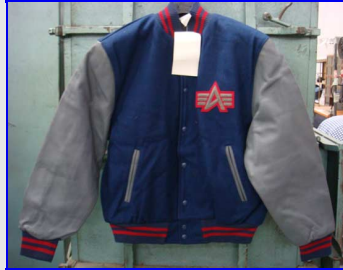
Bomber MA-1 Baseball Made in USA